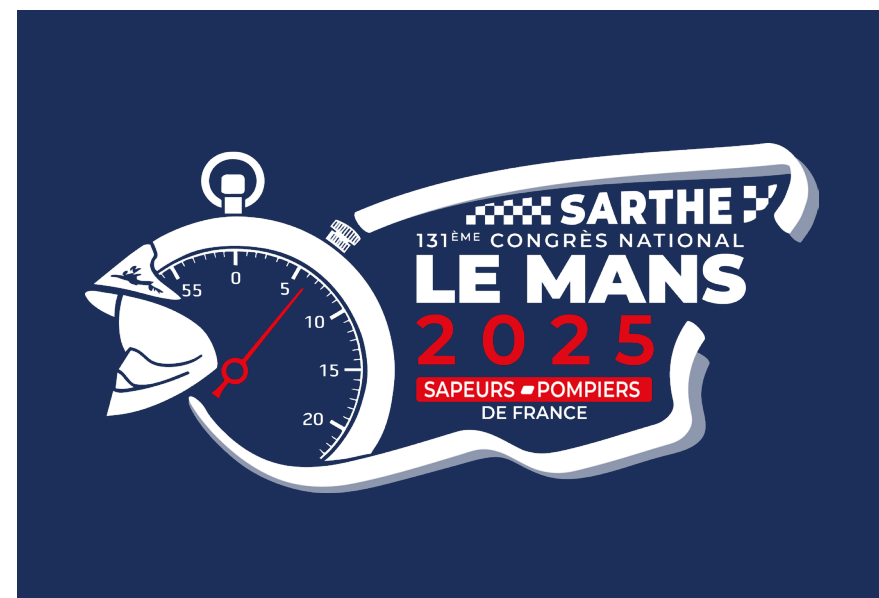
LOGO POUR FOND FONCÉ